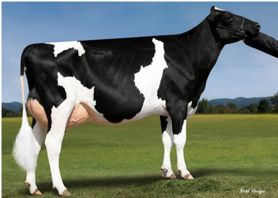
OCD JEDI TAYA 37904 FOURTH DAM